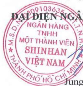
Jung Hyun Su